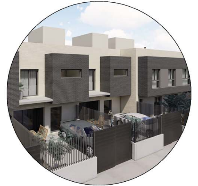
VIVIENDAS A1-A2-A3-A4 (PARCELA 74)